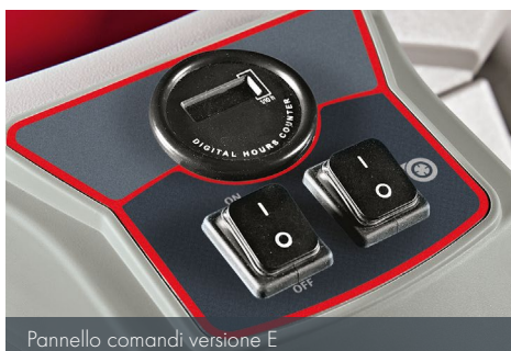
Pannello comandi versione E