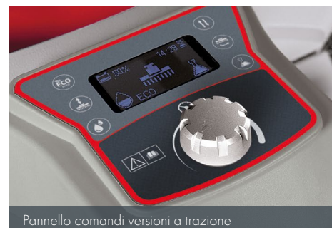
Pannello comandi versioni a trazione

Le versioni senza trazione (Antea 50 E/B) sono dotate di un pannello comandi essenziale che favorisce un utilizzo immediato.