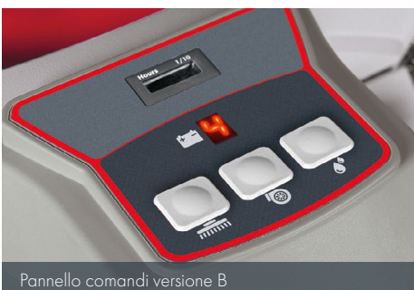
Pannello comandi versione B